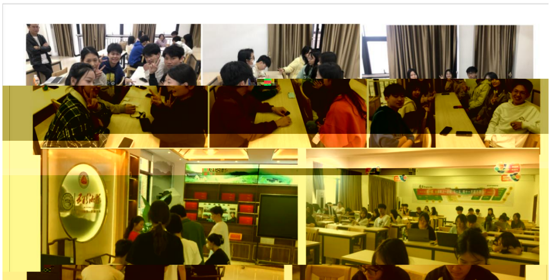
中国留学人员选拔委员会